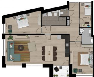
Begane grond, Verlingebek - Appartement 1 De plattegrond is slechts een voorbeeld afbeelding. Er kunnen geen rechten aan ontleend worden.