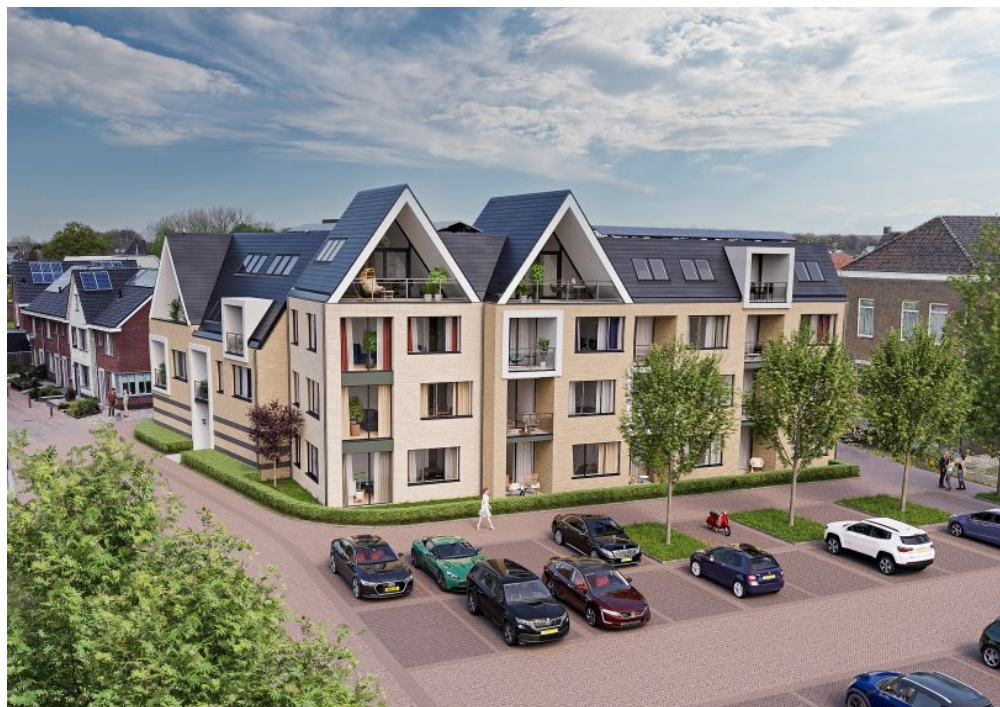
Achter het Vrijthof 5821 BJ Vierlingsbeek type A Vraagprijs: € 385.000,-- k.k.