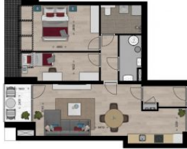
2e Verdieping, Vierlingsbeek - Appartement 10 De afmetingen zijn geschikt voor standaard meubelen. Er kunnen geen rechten worden afgeleid uit deze afbeelding.