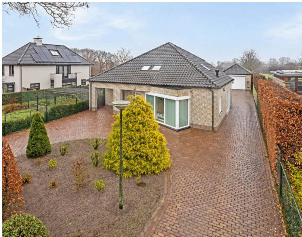
Putterstraat 5451 VR Mill 5A Vraagprijs: op aanvraag.k.